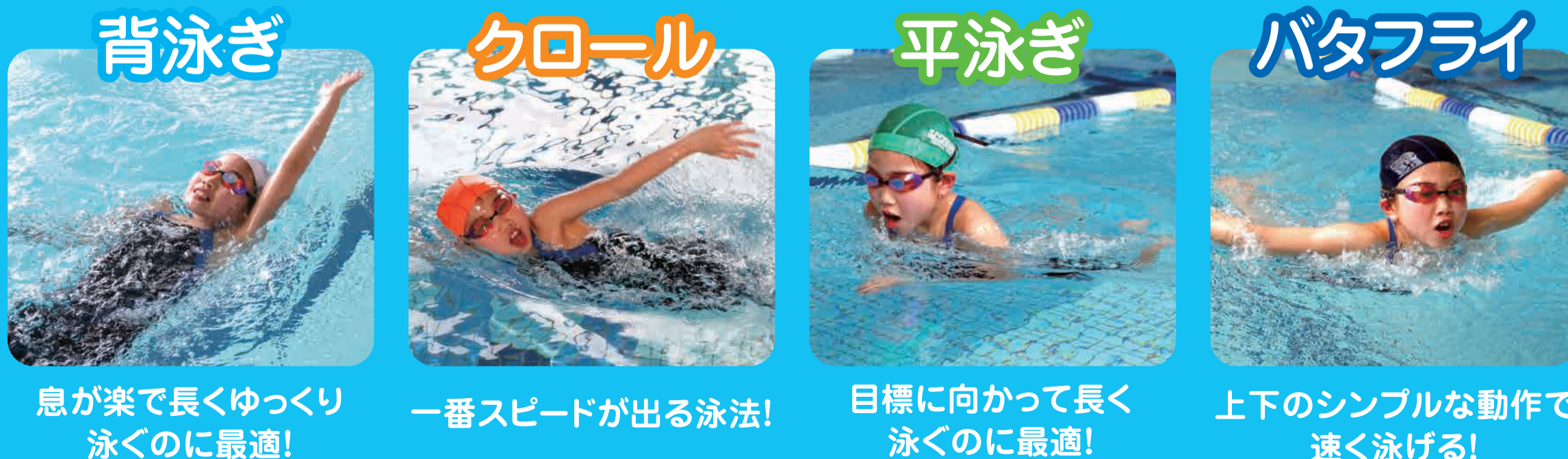
息が楽で長くゆっくり泳ぐのに最適! | 一番スピードが出る泳法! | 目標に向かって長く泳ぐのに最適! | 上下のシンプルな動作で速く泳げる!