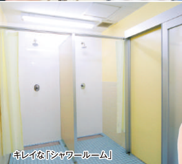
キレイな「シャワールーム」