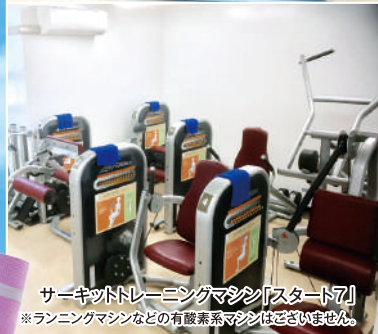
サーキットトレーニングマシン「スタート7」 ※ランニングマシンなどの有酸素系マシンはございません。